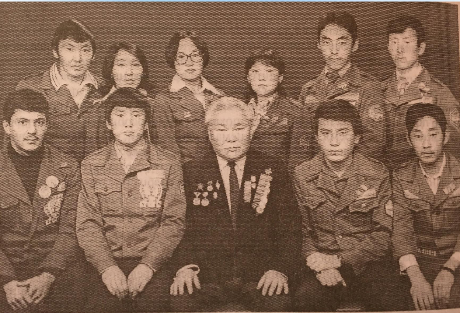
Почетный боец ССО "Марыкчан".